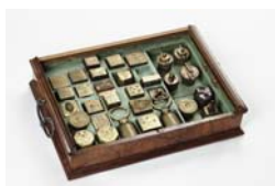
Normalgewichtssammlung des Leipziger Rates, 1719/1722, furniertes Holz, Metall, 21,5 × 48 × 33,5 cm (Kasten), Stadtgeschichtliches Museum Leipzig