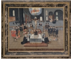
Austeilung des Abendmahls in Gegenwart der protestantischen Fürsten (Konfessionsgemälde aus Luckau), 1689, Öl auf Holz, Evangelische Kirchengemeinde St. Nikolai, Luckau