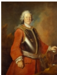
Louis de Silvestre: Jean de Bodt, 1729, Öl auf Leinwand, 130 x 100 cm, Gemäldegalerie Alte Meister, Staatliche Kunstsammlungen Dresden