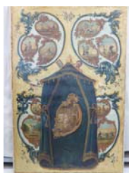
Ahlsdorfer Bildtapete, Mittelstück der Westwand des Gesellschaftszimmers, um 1775, Fotografie von 2014 (Zustand nach der Restaurierung)