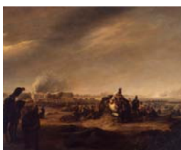
Julius Ferdinand Wilhelm Sattler: Schlacht bei Dresden 1813, nach 1813, Öl auf Leinwand, 136 x 166 cm (Rahmen), Dresden, Militärhistorisches Museum der Bundeswehr (als Dauerleihgabe derzeit im Deutschen Historischen Museum)