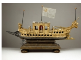
Alessandro Mauro: Modell des Lustschiffes »Bucentauro«, Dresden 1719, Holz, Blattgold, Lackfarbe, Taft, Federn, Rüstkammer, Staatliche Kunstsammlungen Dresden, Foto: Elke Estel/ Hans-Peter Klut