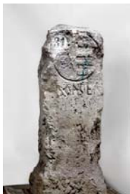
Grenzstein mit kursächsischem und kurbrandenburgischem Wappen, um 1580, Stadtverwaltung Beelitz-Hauptamt, „Alte Posthalterei Beelitz“, Beelitzer Heimatmuseum, Foto: Thomas Kläber