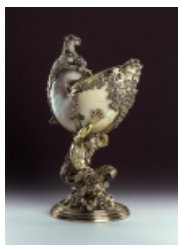
Balthasar Permoser: Nautiluspokal (Entwurf), Bernhard Quippe (Ausführung), Um 1707; Nautilusgehäuse, Silber, vergoldet, Grünes Gewölbe, Staatliche Kunstsammlungen Dresden